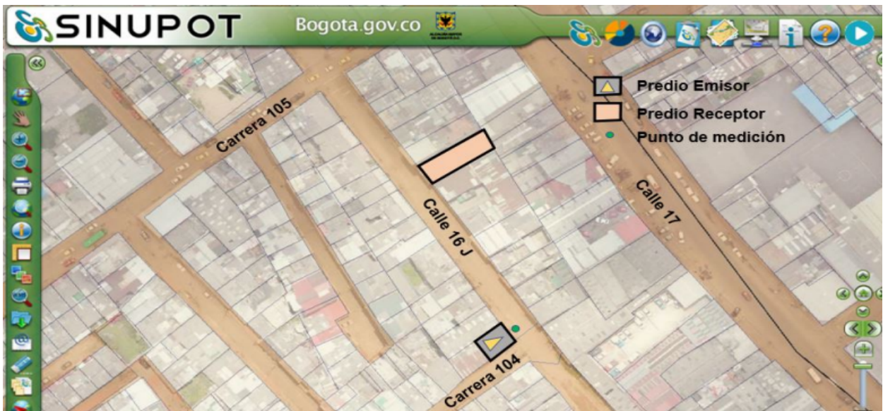
Figura No. 1. Ubicación del predio emisor, predio receptor (CL 16 J No. 104 - 48) y punto de medición.